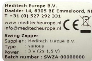
Abb. 4.2 Typenschild